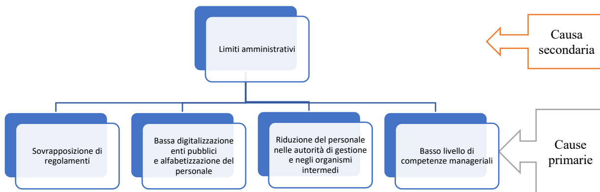
Figura 3 - Le cause primarie dell'inefficienza amministrativa in Italia

Il PNRR riuscirà a incidere su queste cause primarie indicate nella Figura 3? È proprio tentando di elaborare una strategia per superare questa sfida che il Governo Draghi e il Parlamento si sono dovuti confrontare con il tema del contesto normativo di riferimento della formazione e del livello del capitale umano nella nostra P.A. Vediamo perché.